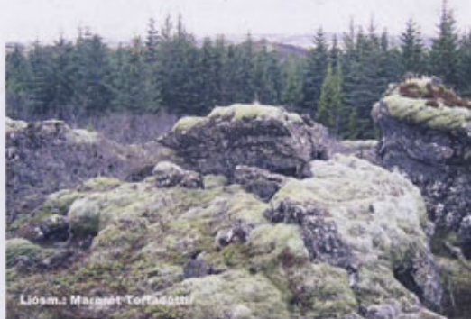
Úr skógræktarreit Skaftfellingafélagsins í Heiðmörk

Laugardaginn 28. maí er fyrirhuguð árleg grisjun og fegrún í skógræktarreit Skaftfellingafélagsins í Heiðmörk. Vonast er til að áhugasamir sjái sér fært að taka til hendinni og mæti með sagir og klippur, á tímabilinu frá kl. 10-16. Fyrir þá sem ekki þekkja leiðina að reit félagsins, þá er farið af Suðurlandsvegi inn á Heiðmerkurveg rétt fyrir austan brúna á Hólmsá. Ekið eftir veginum Hraunslóð, 1,5 km en við hann stendur skiltið Skaftafell þar sem reiturinn okkar er. Fólk taki með sér nesti og ef vel viðrar verður e.t.v. slegið í grill.