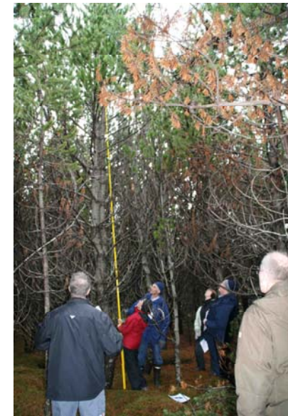
Fjölmennum í Heiðmörk 16. maí